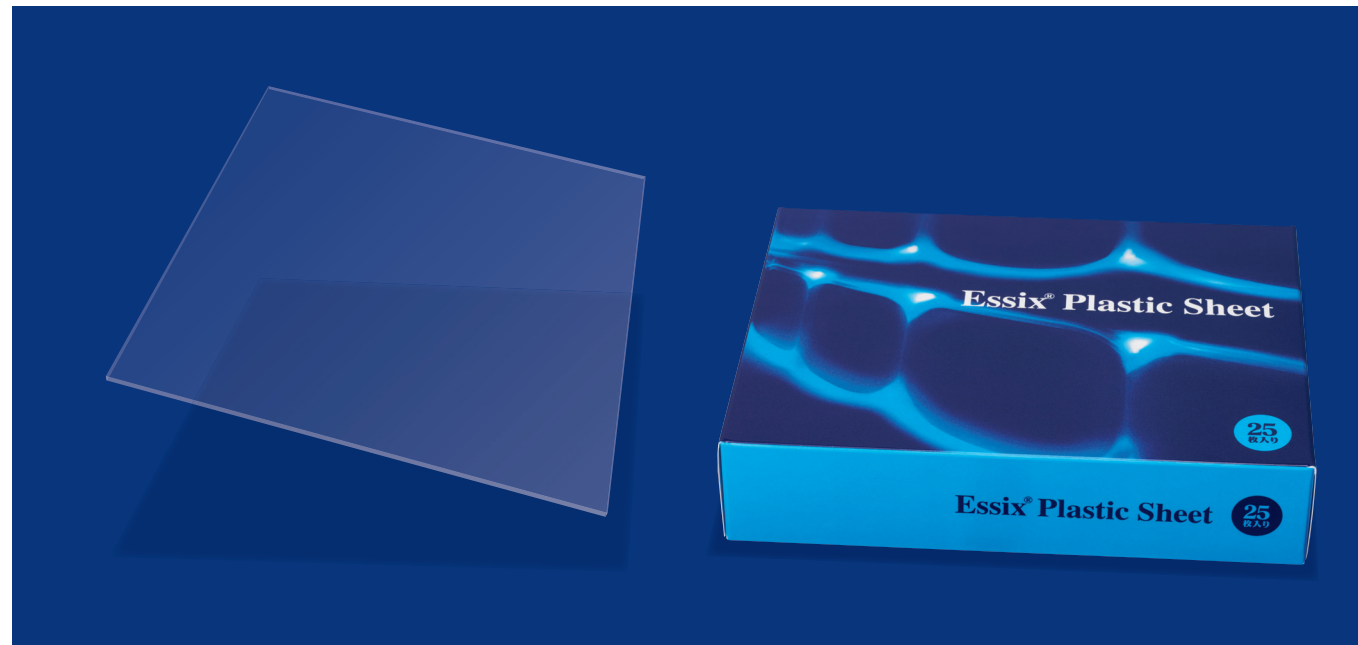
※パッケージは予告なく変更になる場合があります。