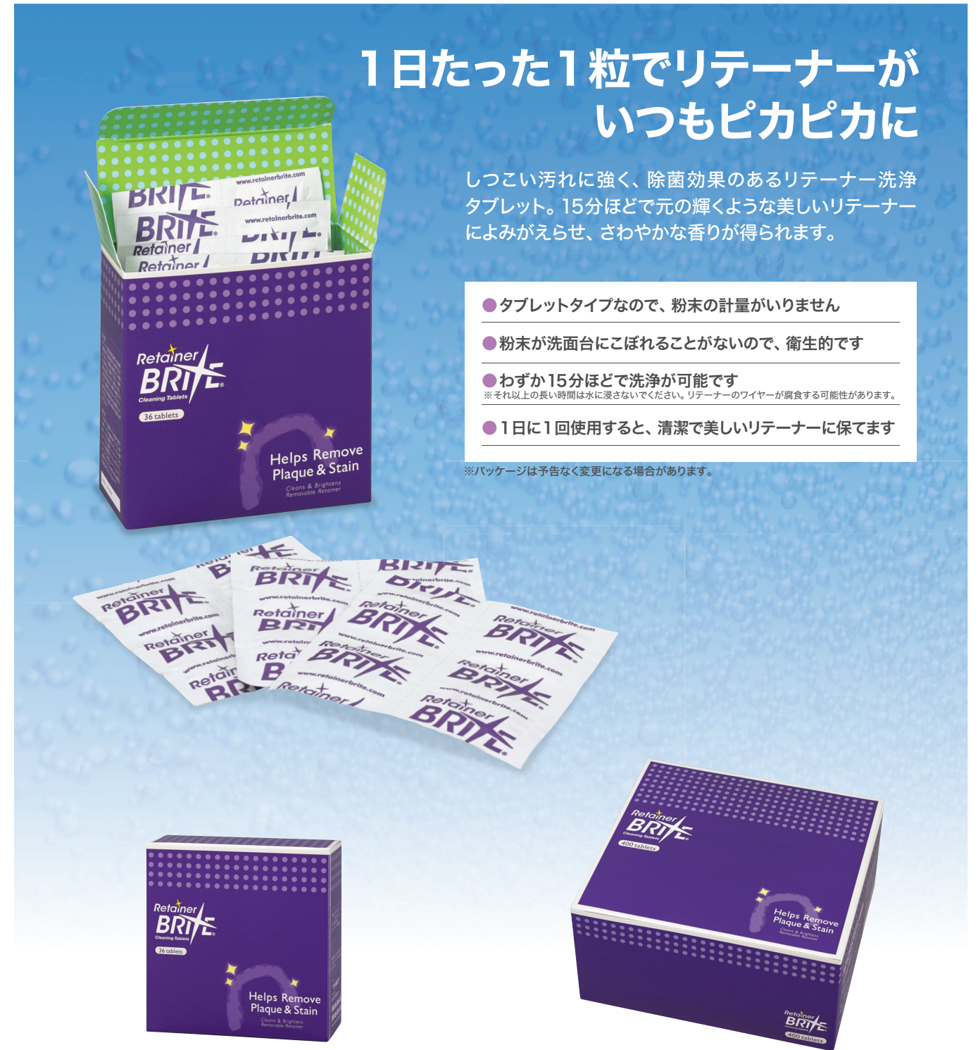
■ リテーナーブライト (標準サイズ)